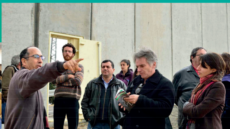
Mission du REF en Palestine, Bethléem, février 2014.