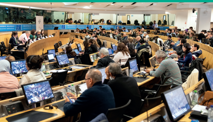
Forum Civil de Bruxelles (programme MAJALAT), décembre 2019.

Campagnes d'interpellation, publications à travers Les Cahiers du REF et débats publics autour des grands enjeux méditerranéens actuels.