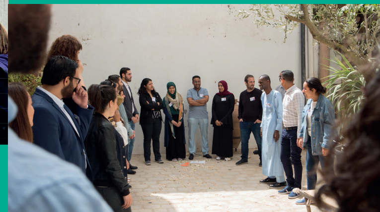
Rencontre du Réseau « Jeunesses méditerranéennes », Tunis, avril 2019